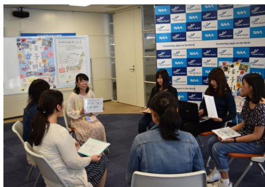
活動の様子(成田空港にて)