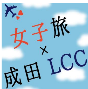
【女子旅×成田 LCC】ロゴ画像

※Instagramは米国およびその他の国におけるInstagram, LLCの商標です。