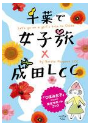
【女子旅×成田 LCC】サポートブック ダウンロードページ

関東在学の学生が主体となり、若年層の旅行需要喚起、千葉県観光促進、成田空港の利用促進を目的に取り組んでいる、成田空港活用協議会の学生連携プロジェクトです。