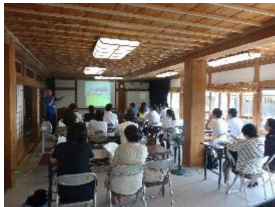
房総のむらでは、体験メニューなどの説明を受ける