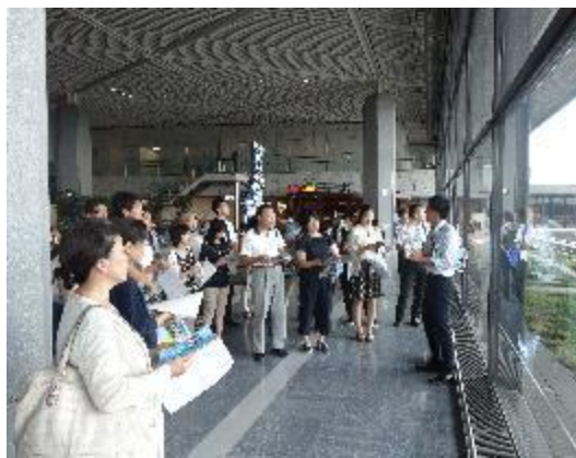
成田空港の見学風景